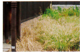
遊休地の活用や売却を お考えの方