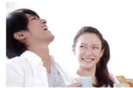
ご結婚予定で 新居をお探しの方