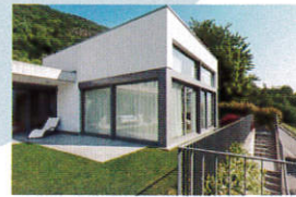
土地をお探しの方、 または建替えをお考えの方