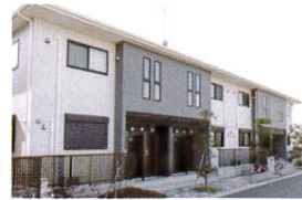
賃貸(併用)住宅に ご興味のある方