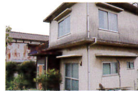
空き家の管理に お困りの方